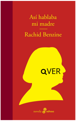
Así hablaba mi madre Rachid Benzine $20.500