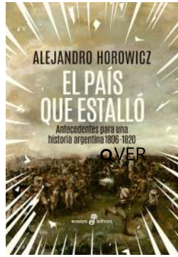
El país que estalló Alejandro Horowicz $37.000