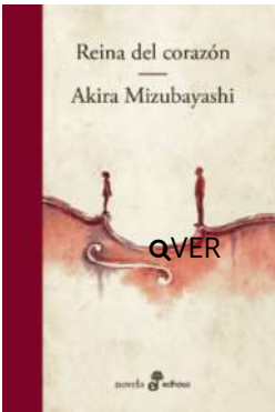
Reina del corazón Akira Mizubayashi $22.500