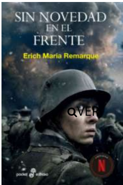
Sin novedad en el frente Erich Maria Remarque $21.500