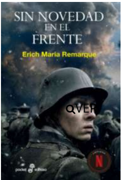
Sin novedad en el frente Erich Maria Remarque $22.500