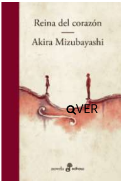
Reina del corazón Akira Mizubayashi $24.500