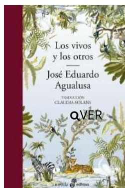
Los vivos y los otros José Eduardo Agualusa $20.500