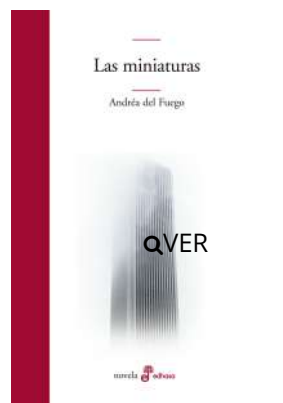
Las miniaturas Andréa Del Fuego $20.500