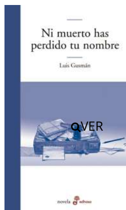
Ni muerto has perdido tu nombre Luis Gusmán $20.500