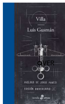
Villa Luis Gusmán $22.500