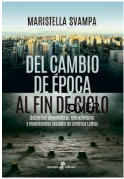
Del cambio de época al fin de ciclo Maristella Svampa $24.000