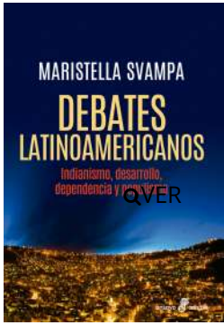
Debates latinoamericanos Maristella Svampa $42.000