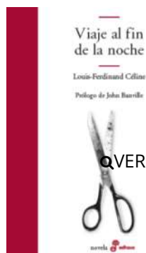
Viaje al fin de la noche Louis-Ferdinand Céline, John Banville $43.000