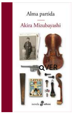
Alma partida Akira Mizubayashi $22.500