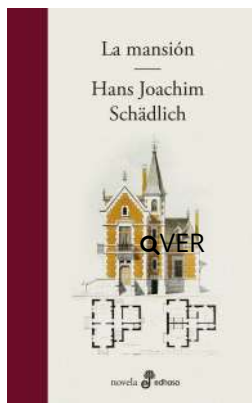
La mansión Hans Joachim Schädlich $20.500