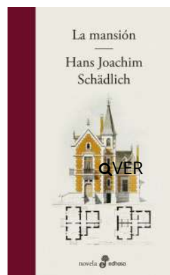
La mansión Hans Joachim Schädlich $21.000