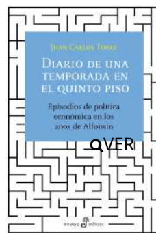
Diario de una temporada en el quinto piso Juan Carlos Torre $40.000