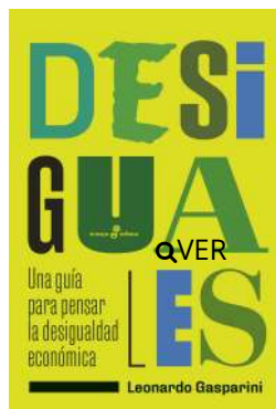
Desiguales Leonardo Gasparini $23.500