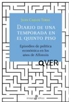
Diario de una temporada en el quinto piso Juan Carlos Torre $39.500