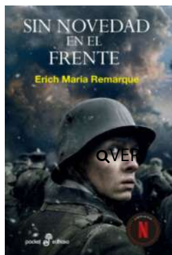
Sin novedad en el frente Erich Maria Remarque $21.500