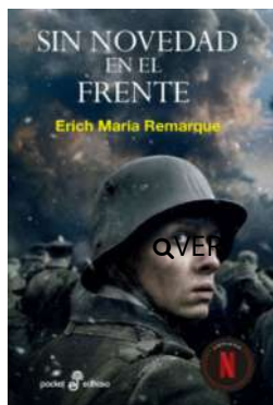
Sin novedad en el frente Erich Maria Remarque $22.500