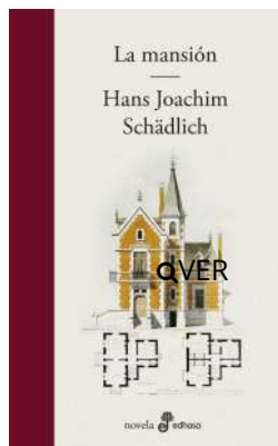
La mansión Hans Joachim Schädlich $20.500