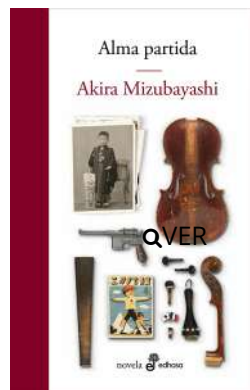
Alma partida Akira Mizubayashi $24.500